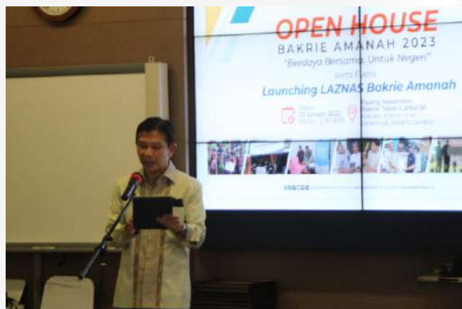
Foto : Kegiatan Open House 2023

Bakrie Amanah kembali menggelar kegiatan Open House di tahun 2023. Open House tahun ini menjadi spesial mengingat status baru bagi Lembaga Amil Zakat (LAZ) Bakrie Amanah sebagai LAZ berskala nasional. Kegiatan yang dilaksanakan di Ruang Nusantara, Bakrie Tower ini merupakan agenda rutin Bakrie Amanah dalam menyampaikan laporan tahunan kegiatan yang telah dilaksanakan di 2022 kepada para stakeholders dan memperkenalkan program-program yang akan dilaksanakan Bakrie Amanah di 2023.