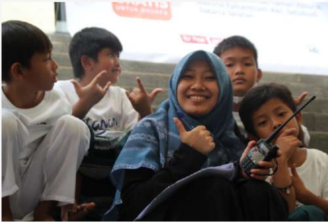
Foto : Kegiatan khitanan di Masjid Al Bakrie Jakarta, Keceriaan Anak

Kegiatan khitanan ceria di tahun 2022 kembali digelar. Pelaksanaan khitanan ceria merupakan salah satu rangkaian program festival muharram 2022. Kegiatan ini dilaksanakan di Masjid Al Bakrie Jakarta. Kehadiran lebih dari 100 anak yatim & dhuafa sebagai peserta khitan.