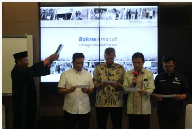
Foto : Sumpah amil Bakrie Amanah di acara Open House 2023

Bakrie Amanah kembali menggelar kegiatan Open House di tahun 2023. Open House tahun ini menjadi spesial mengingat status baru bagi Lembaga Amil Zakat (LAZ) Bakrie Amanah sebagai LAZ berskala nasional. Kegiatan yang dilaksanakan di Ruang Nusantara, Bakrie Tower ini merupakan agenda rutin Bakrie Amanah dalam menyampaikan laporan tahunan kegiatan yang telah dilaksanakan di 2022 kepada para stakeholders dan memperkenalkan program-program yang akan dilaksanakan Bakrie Amanah di 2023.