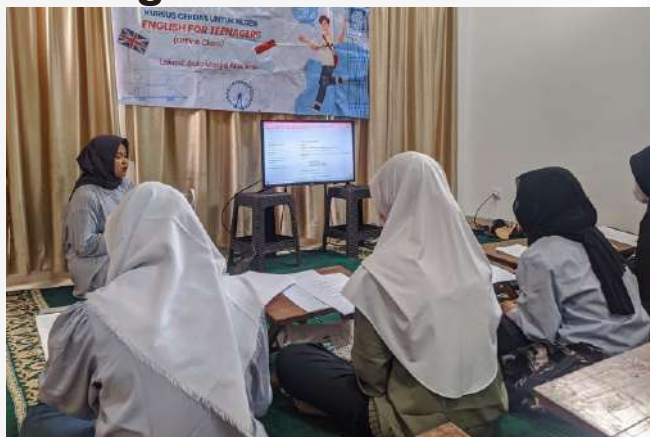
Foto : Kursus sedang berlangsung

Bakrie Amanah kembali melaksanakan program kursus bahasa inggrisnya. Berbeda dengan sebelumnya dimana kursus ditujukan untuk anak - anak, pada program kali ini kursus ditujukan untuk para remaja SMP/Sederajat hingga SMA/SMK/Sederajat. Sama seperti pelatihan sebelumnya kursus english for teenagers dilaksanakan selama 6 pertemuan dengan satu kali pertemuan setiap pekannya.