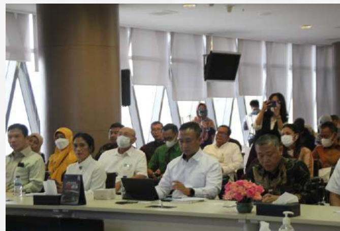
Foto : Stakeholder yang hadir di Open House 2023