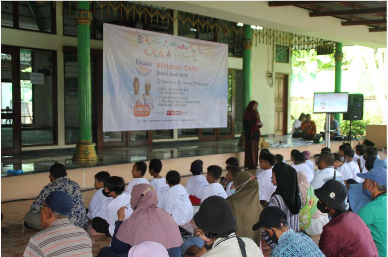
Foto : Kegiatan khitanan di PT Bakrie Pipe Industries

Sebagai bentuk dukungan terhadap kesehatan anak, Bakrie Amanah bersama Kelompok Usaha Bakrie Bekasi menggelar Khitanan Ceria. Sebanyak 50 anak penerima manfaat kesehatan di khitan pada acara ini. Kegiatan khitanan ceria ini dilaksanakan di PT Bakrie Pipe Industries, Kec. Medan Satria, Kota Bekasi (24/12). Di lokasi ini juga merupakan salah satu kantor unit cabang Bakrie Amanah yang berada di wilayah Jawa Barat.