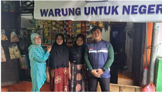
Foto : Pendampingan UMKM Bakrie Amanah