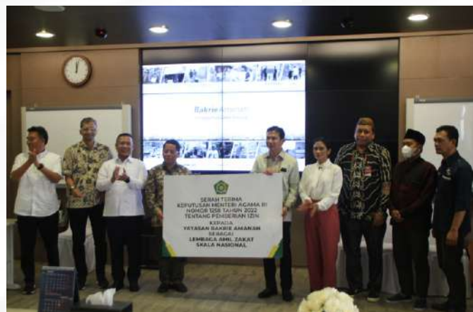
Foto : Serah terima simbolis SK Laznas Bakrie Amanah oleh Kementerian Agama RI

“Alhamdulillah, setelah 12 tahun Bakrie Amanah beroperasi sebagai Lembaga Amil Zakat di Kelompok Usaha Bakrie, kini Bakrie Amanah diberikan kepercayaan oleh regulator perzakatan Nasional untuk mengelola zakat dalam lingkup nasional. Apresiasi yang tinggi kami sampaikan kepada Baznas dan Kemenag yang telah memberikan kepercayaan kepada kami,” jelas Roy