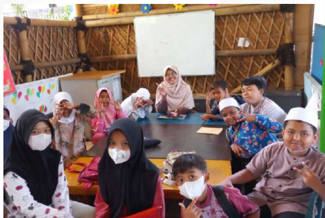
Foto : Pengembangan potensi dan bakat anak

Mengawali tahun 2023, Bakrie Amanah kembali melakukan pembinaan program pengembangan potensi dan bakat anak terhadap anak - anak binaan penerima beasiswa cerdas untuk negeri. Program yang dilaksanakan pada (29/1) merupakan yang pertama di tahun 2023 ini.