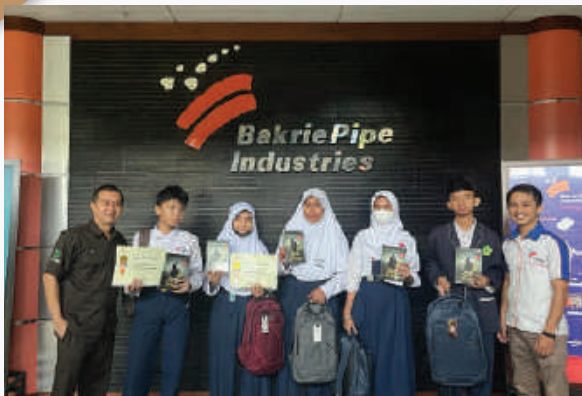
Santunan & Pemberian Alat Sekolah PT Bakrie Pipe Industries, Jawa Barat