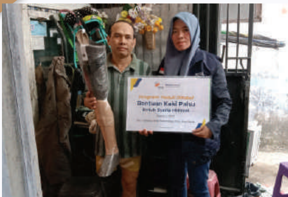
Program Peduli Difabel: Bantuan Kaki Palsu Tasikmalaya, Jawa Barat