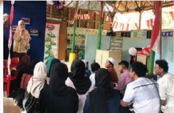
Pengembangan Potensi Bakat Anak Jakarta & Bekasi