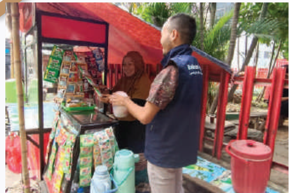
Penguatan Branding Penerima Manfaat Program Amanah Fund Cakung, Jakarta Timur