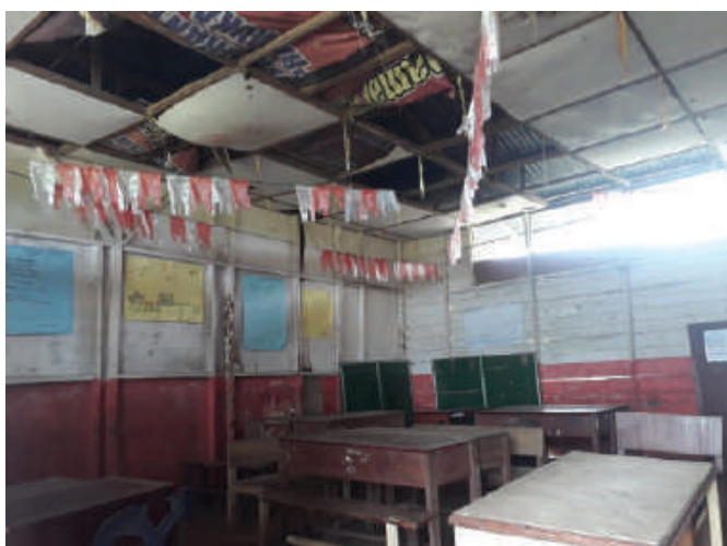
Kondisi Kelas Sebelum Di Renovasi