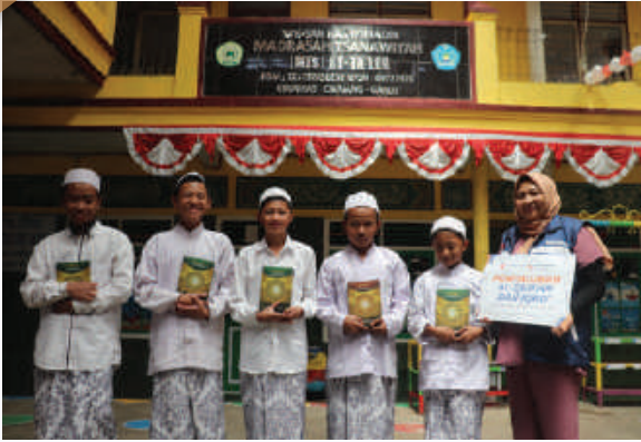
Penyaluran Qur'an dan Iqro Garut, Jawa Barat