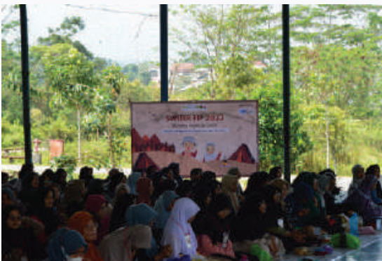
Support Kegiatan Studi Wisata Islam Terpadu Fakultas Ilmu Pendidikan, UNJ