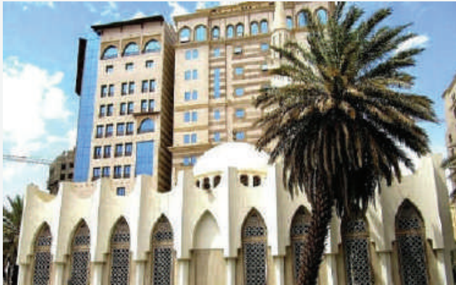
Masjid Utsman bin Affan

Di Madinah berdiri Hotel 15 lantai dengan total 240 kamar, nama hotel tersebut adalah Hotel Utsman Bin Affan Madinah. Dibangun di Markaziyah, tanah elite dekat masjid Nabawi nyatanya hotel tersebut bermula dari sebuah sumur yang diwakafkan oleh Sahabat Utsman Bin Affan. Di bawah pengelolaan Sheraton, Semua penghasilan dari wakaf produktif itu sebagian dibagikan untuk fakir miskin dan anak yatim sedangkan sebagian tetap disimpan atas nama rekening Utsman bin affan.