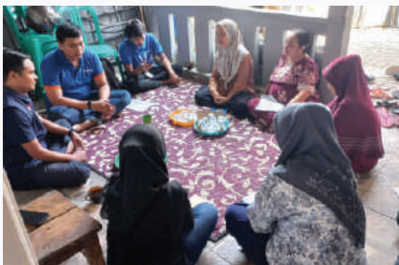
Sosialisasi dan Membangun Komitmen Program Amanah Fund Bogor, Jawa Barat