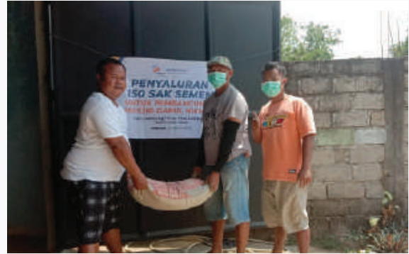
Penyaluran 150 Sak Semen untuk Pembangunan Masjid Darul Hikmah Lampung Timur, Prov. Lampung