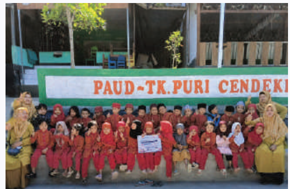
BINA PAUD SEMAI (Selamatkan Generasi Emas Indonesia) PAUD Puri Cendekia, Lombok