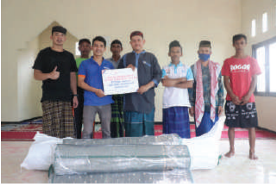
Penyaluran Karpet Masjid & Majelis Taklim, Cianjur, Jawa Barat