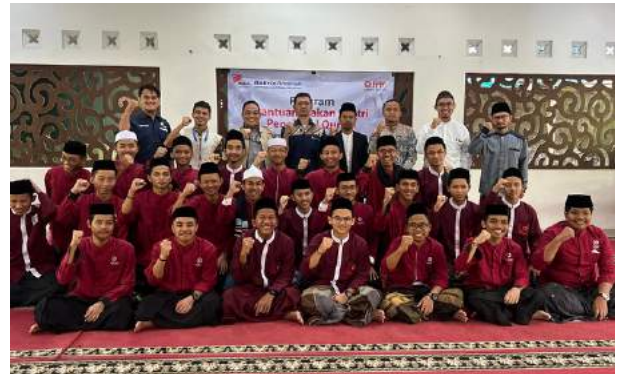
Serah Terima Simbolis Program Makan Santri Penghafal Quran, Pesantren Daarul Qur'an Takhassus Cinagara