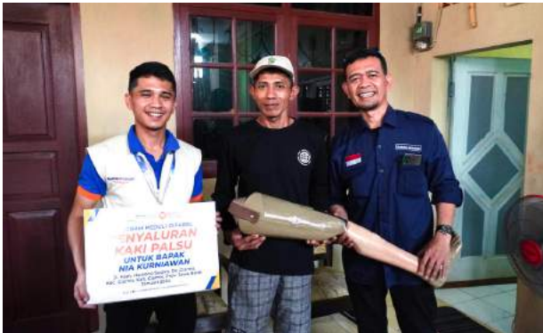
Mendukung Kemandirian Disabilitas dengan Pemberian Kaki Palsu Kab. Ciamis, Jawa Barat