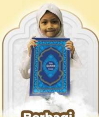
Berbagi Al-Qur'an & Iqra' Rp50.000/Al-Qur'an Rp25.000/Iqra'