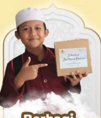
Berbagi Paket Buka Puasa Rp40.000/Paket