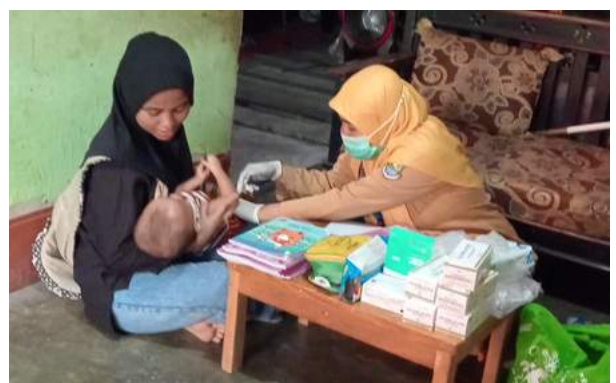
Program Posyandu Mandiri Posyandu Nusa Indah RW 02 Kampung Dadap, Kab. Tangerang