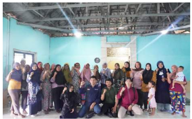
Kunjungan Monitoring oleh BAZNAS RI ke Kampung Dadap Binaan Bakrie Amanah