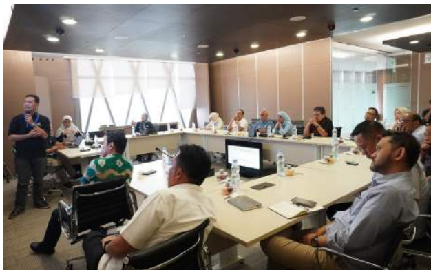
Sosialisasi ZIS Payroll PT Bakrie & Brothers Bakrie Tower, Jakarta Selatan