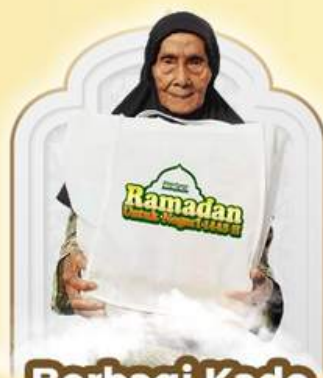
Berbagi Kado Bahagia Ramadan Rp250.000/Paket