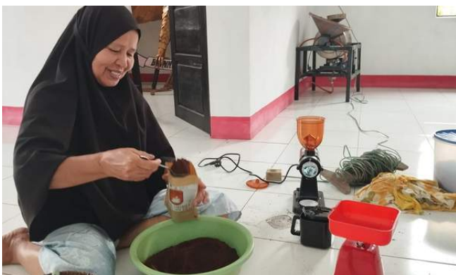
Produksi Kopi Sulung di Rumah Produksi Kopi Sulung, Kabupaten Sambas