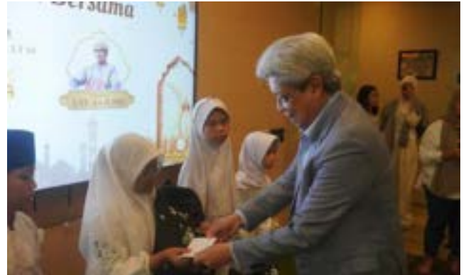
Hangatnya Kebersamaan, Indahnnya Berbagi di PT Bumi Resources Minerals