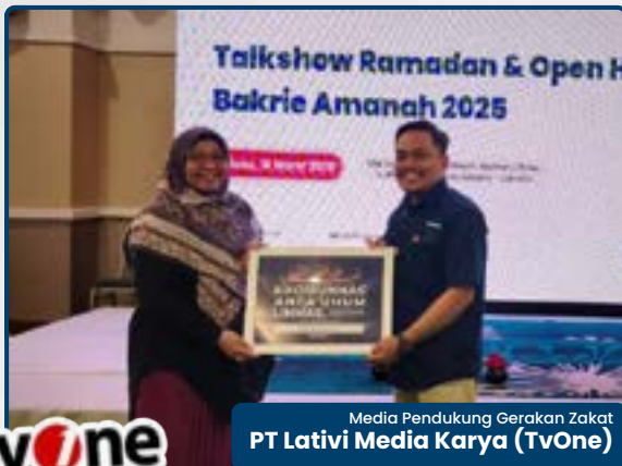
Media Pendukung Gerakan Zakat PT Lativi Media Karya (TvOne)