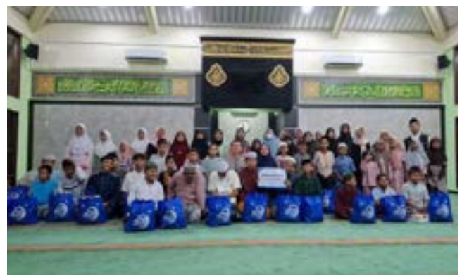
Buka Puasa Bersama PT Bakrie Pipe Industries Bahagiakan Anak Yatim & Dhuafa