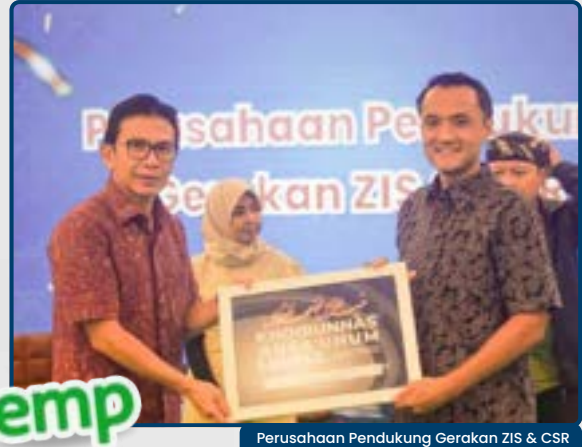
Perusahaan Pendukung Gerakan ZIS & CSR PT Energi Mega Persada Tbk