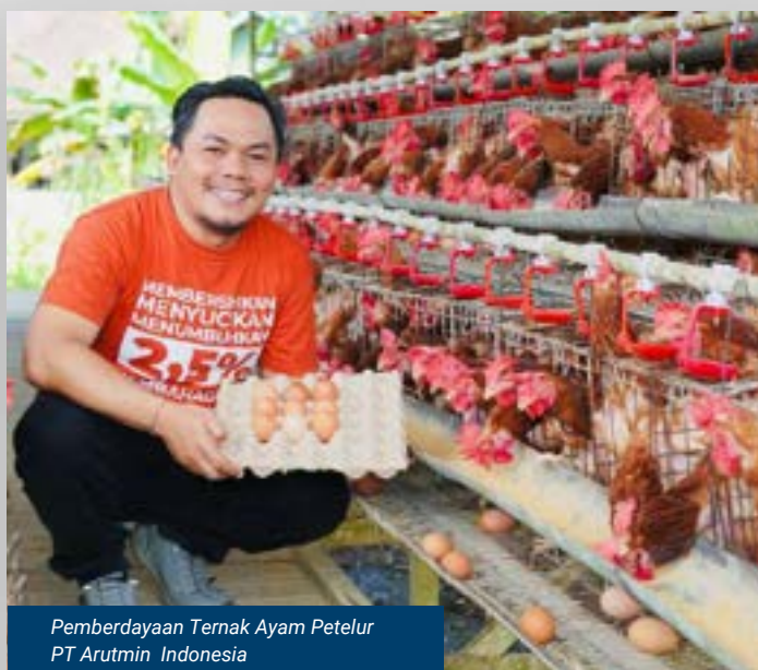
Pemberdayaan Ternak Ayam Petelur PT Arutmin Indonesia