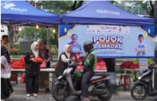
Pojok Ramadan: Hadirkan Kebahagiaan dengan Berbagi Paket Buka Puasa