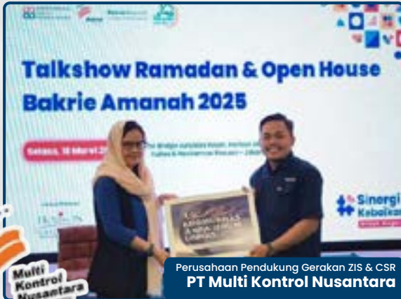
Perusahaan Pendukung Gerakan ZIS & CSR PT Multi Kontrol Nusantara