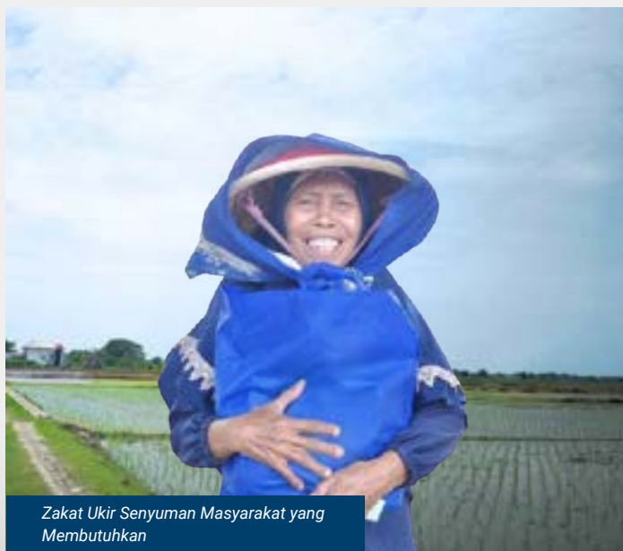
Zakat Ukir Senyuman Masyarakat yang Membutuhkan

Melalui program LAZNAS Bakrie Amanah, zakat yang disalurkan dikembangkan menjadi program berkelanjutan dengan dampak luas bagi masyarakat. Program yang dijalankan mencakup bantuan pendidikan, pemberdayaan ekonomi, kesehatan, serta bantuan sosial lainnya guna meningkatkan kesejahteraan umat secara menyeluruh.