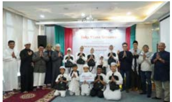
Kado Bahagia Ramadan untuk Anak Yatim/ Dhuafa dari PT Bakrie Sumatera Plantations Tbk