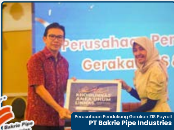
Perusahaan Pendukung Gerakan ZIS Payroll PT Bakrie Pipe Industries