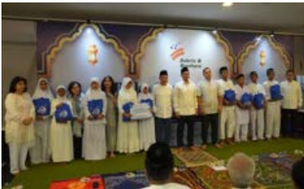
Santunan Penuh Cinta dari Bakrie & Brothers Group