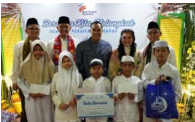
Kado Bahagia Ramadan untuk Anak Yatim/ Dhuafa dari PT Multi Kontrol Nusantara