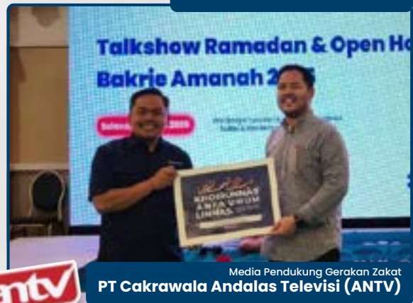
Media Pendukung Gerakan Zakat PT Cakrawala Andalas Televisi (ANTV)