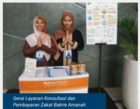
Gerai Layanan Konsultasi dan Pembayaran Zakat Bakrie Amanah

Sementara itu, pada masa Utsman bin Affan dan Ali bin Abi Thalib, sistem pengelolaan zakat semakin berkembang dengan pencatatan dan distribusi yang lebih terstruktur.