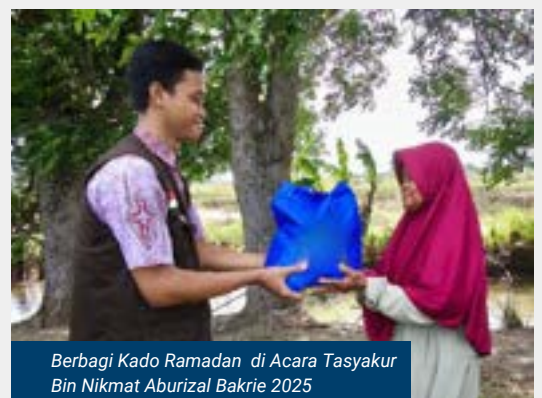
Berbagi Kado Ramadan di Acara Tasyakur Bin Nikmat Aburizal Bakrie 2025