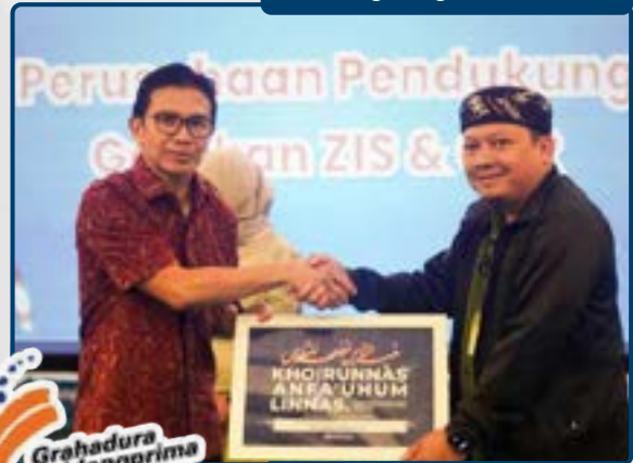
Perusahaan Pendukung Gerakan ZIS Payroll PT Grahadura Leidong Prima