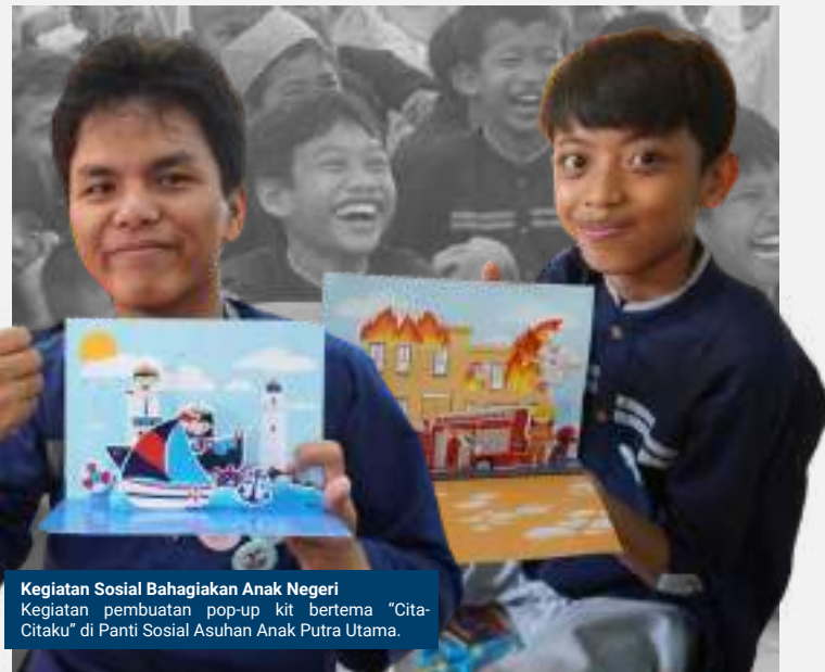
Kegiatan Sosial Bahagiakan Anak Negeri Kegiatan pembuatan pop-up kit bertema "Cita-Citaku" di Panti Sosial Asuhan Anak Putra Utama.