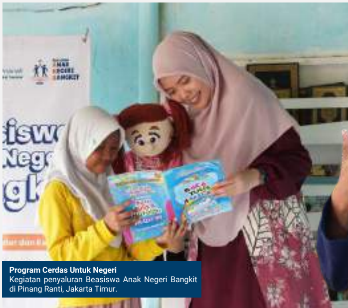
Program Cerdas Untuk Negeri Kegiatan penyaluran Beasiswa Anak Negeri Bangkit di Pinang Ranti, Jakarta Timur.