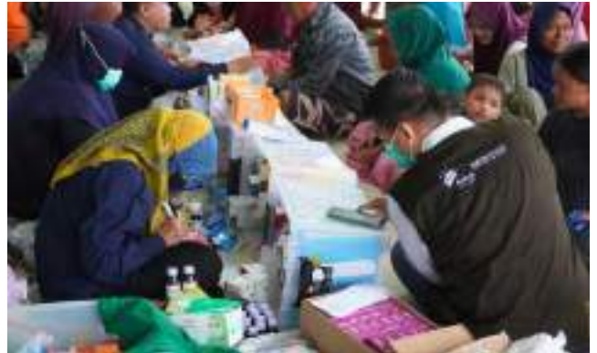
Layanan Kesehatan Masyarakat Rutin di Kampung Makmur Bakrie, Dadap, Tangerang