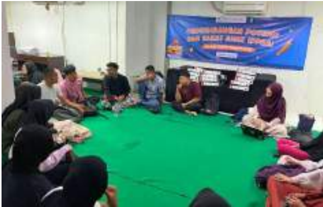
Pembinaan Beasiswa Cerdas Untuk Negeri: Menenal Kecerdasan Sosial Emosional