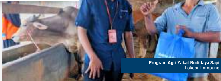
Program Agri Zakat Budidaya Sapi Lokasi: Lampung

Semangat ini terus dihidupkan oleh LAZNAS Bakrie Amanah melalui berbagai program pemberdayaan zakat yang bertujuan mengangkat derajat mustahik menjadi munfik, bahkan muzaki.