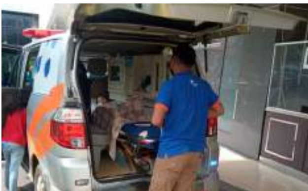
Layanan Pasien Siaga Ambulance Bakrie Amanah