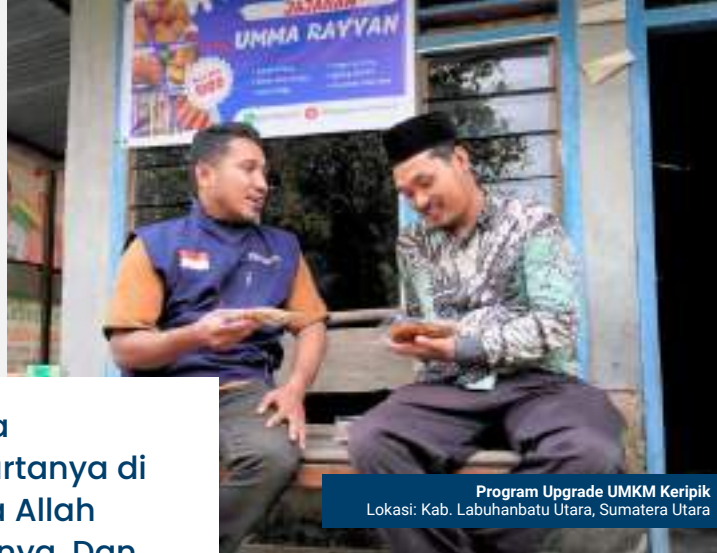
Program Upgrade UMKM Keripik Lokasi: Kab. Labuhanbatu Utara, Sumatera Utara

“Dan barangsiapa menafkahkan hartanya di jalan Allah, maka Allah akan menggantinya. Dan Dia adalah sebaik-baik pemberi rezeki.