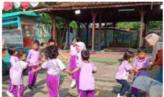
Bina PAUD SEMAI: Kegiatan Belajar Mengajar PAUD Cempaka Jakarta