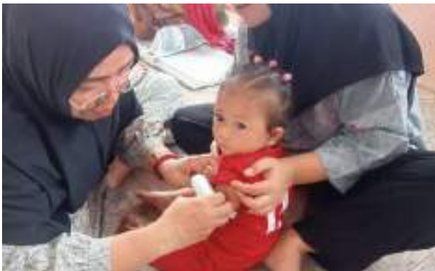
Posyandu Mandiri Rutin untuk Mengetahui Tumbuh Kembang Balita