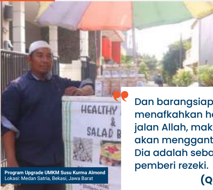
Program Upgrade UMKM Susu Kurma Almond Lokasi: Medan Satria, Bekasi, Jawa Barat