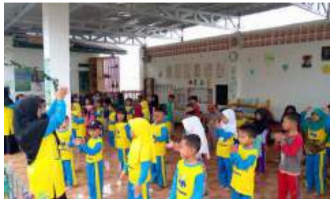
Bina PAUD SEMAI: Kegiatan Belajar Mengajar PAUD Darul Hikam Garut