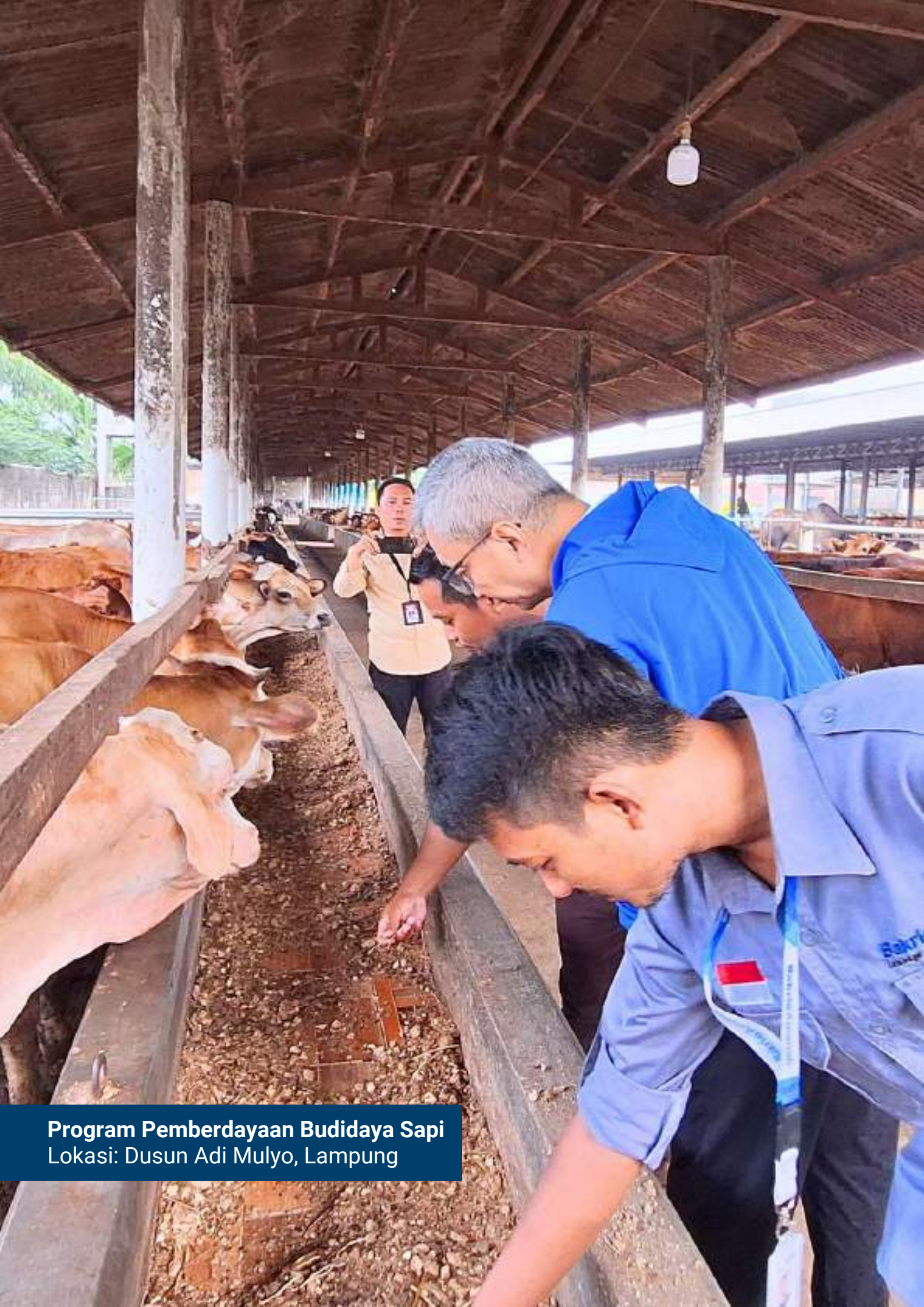
Program Pemberdayaan Budidaya Sapi Lokasi: Dusun Adi Mulyo, Lampung