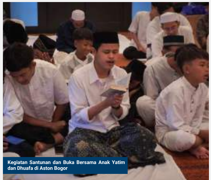
Kegiatan Santunan dan Buka Bersama Anak Yatim dan Dhuafa di Aston Bogor

Sampai saat ini, tantangan yang dihadapi umat masih relevan—mulai dari kemiskinan, kesenjangan akses pendidikan, hingga ketimpangan dalam pemerataan kesejahteraan ekonomi di masyarakat.